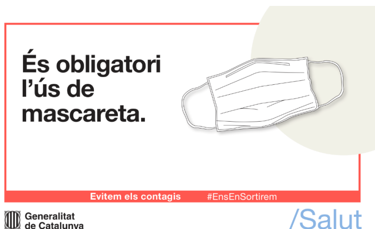
Imatge 6: Cartell recordatori de l'ús de mascareta a les entrades.

Durant les entrades i sortides no podrà accedir cap familiar al recinte excepte causes de força major. Durant el torn d'entrada i sortida es realitzarà la comprovació i registre de símptomes esmentats en el punt 3.3.1: