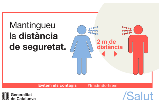
Imatge 1: Cartell recordatori mantenir la distància de seguretat.

Per l'associació hi haurà cartells físics penjats per les diferents parts de la instal·lació que recordin la necessitat de mantenir les distàncies de seguretat (imatge 1).