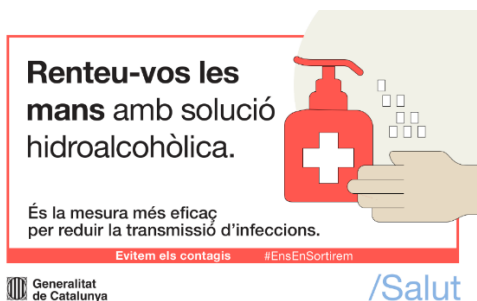
Imatge 5: Cartell recordatori ús solució hidroalcohòlica.

Es posarà un punt de rentat de mans amb solució hidroalcohòlica a les portes de cada sala, amb un dosificador automàtic i tovalloles d'un sol ús. També disposarem d'una catifa de neteja de calçat a la entrada de cada sala.